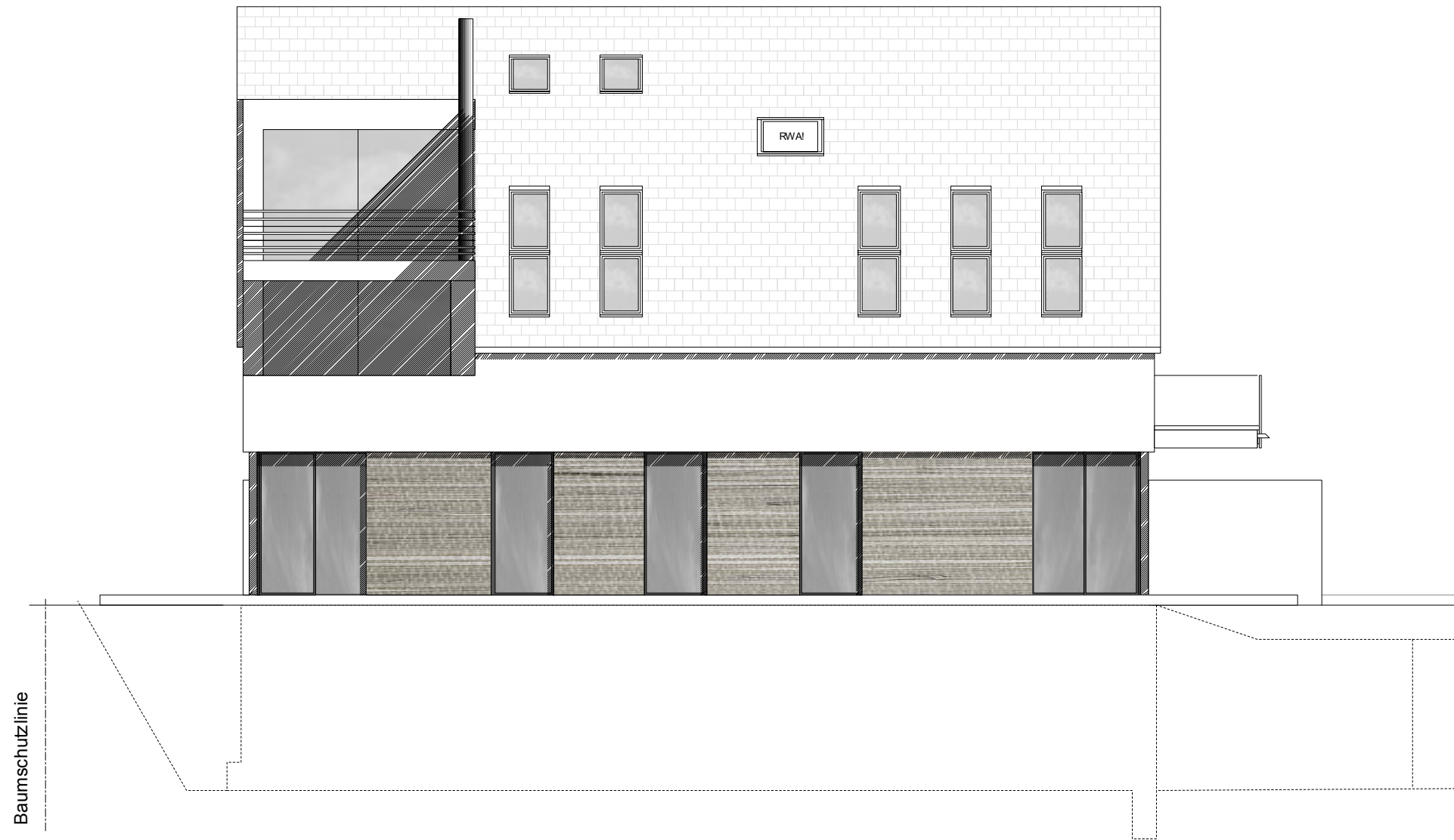
ANSICHT SÜD - HAUS 2